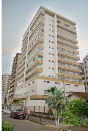
TABELA DE REVENDAS