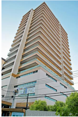
TABELA DE REVENDAS